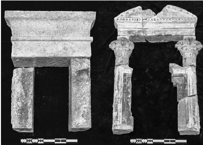
Fig. 4. Decorazione di due delle 15 cappelle in ST 6A

9287) e datato al 50 d.C. (anno XI dell'imperatore Claudio) 23 . All'interno quasi tutte le nicchie erano intonacate con stucco bianco; in esse erano forse collocate statuette ma anche probabilmente dipinti su tavola. Poche e frammentarie sono le sculture rinvenute, come la parte inferiore di una statuette raffigurante un probabile dio Ptah in calcare, e due teste di cocodrillo in legno stuccato e dorato. I pannelli lignei dipinti dovevano essere numerosi, data la notevole concentrazione in questa sala di parti di essi e di cornici. Erano composti da più tavole affiancate e assemblate in cornici di legno, a formare veri e propri quadri. Non è chiaro dove fossero collocati, ma l'assenza di impianti per la sospensione suggerisce potessero essere sul fondo delle nicchie, visibili solo in parte attraverso la decorazione architettonica anteposta. I motivi raffigurati sulle tavole rinvenute sono molto frammentari e talora di difficile lettura a causa della perdita di parti dello stucco dipinto. Alcuni frammenti, tuttavia,