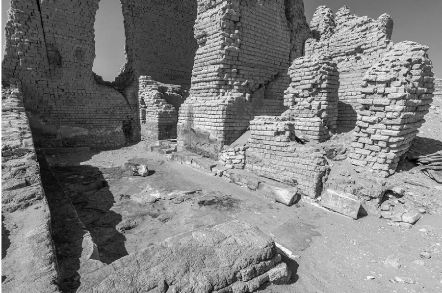
Fig. 12. Sala ST 6B antistante a ST 6A

L'ingresso a ST 6A era costituito da un portale in blocchi di calcare giallo di cui resta solo la base con la soglia, situato al centro del lato corto sud. Ad esso si giungeva attraverso una stanza che fungeva da vestibolo, orientata est-ovest e dotata lungo tutto il perimetro interno di panche in blocchi di pietra riutilizzati, che fungevano da sedili (Fig. 12). Sembra dunque trattarsi di una sala per riunioni. Per ora la mancanza di epigrafi non consente una precisa attribuzione cronologica e funzionale: potrebbe trattarsi per entrambe di sale ad uso dei sacerdoti o delle confraternite.