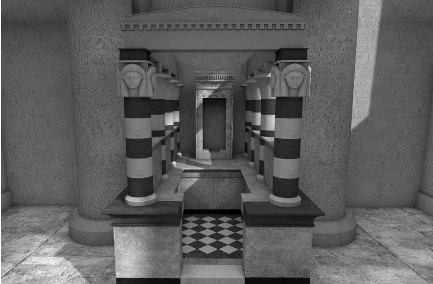
Fig. 14. Ricostruzione virtuale della cappella pseudo periptera nel contra-temple (realizzazione M. Limoncelli)

nica e del disegno suggerisce che questi pavimenti siano stati realizzati contemporaneamente, probabilmente durante il II secolo d.C.