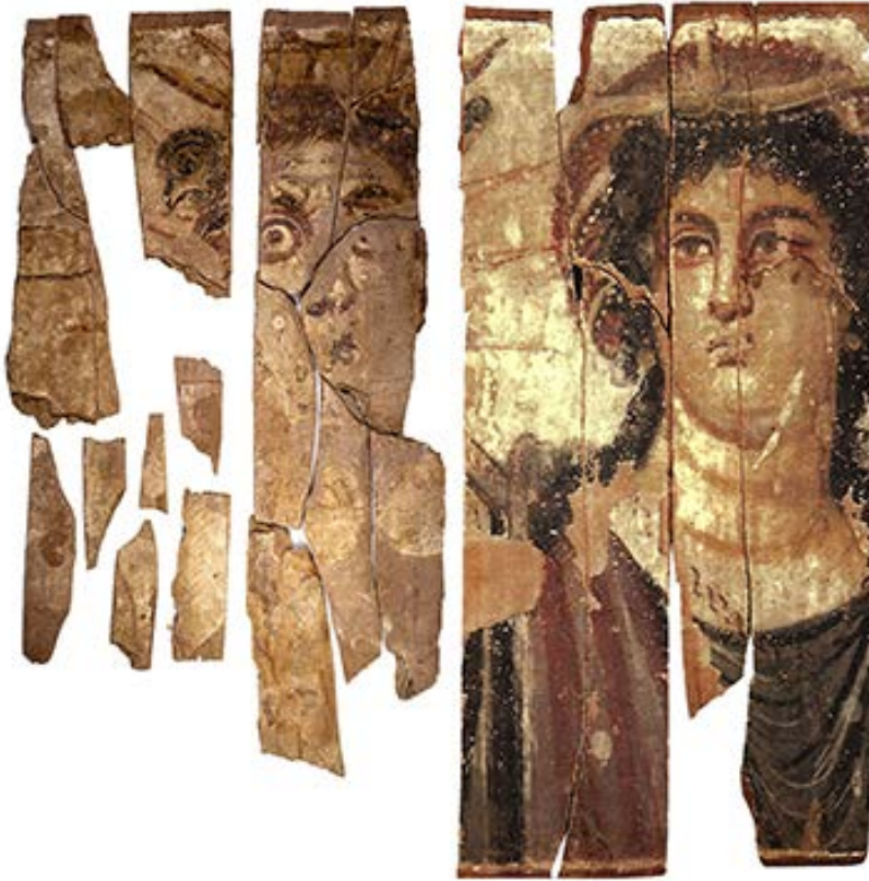
Fig. 5. Ricostruzione virtuale del pannello Dime ST21/1402/6599 e JE 38250 (Per quest'ultimo @Vincent Rondot, Derniers visages des dieux d'Egypte , p. 111)

sono di particolare interesse poiché appartengono a tavole dipinte rinvenute in passato e conservate in varie collezioni. Grazie alla pubblicazione di V. Rondot, Dernier visages des dieux d'Egypte (Paris 2013), è stato possibile abbinare ad alcune tavole i nostri pezzi che vanno così a “completare” raffigurazioni la cui provenienza era finora ignota. Sono così state ricontestualizzate almeno tre tavole dipinte di cui non era noto il luogo preciso di rinvenimento, come è del resto accaduto per molti oggetti e papiri venduti alla fine del XIX secolo sul mercato antiquario. Le tavole dipinte sono conservate nel Museo Egizio del Cairo e ad Oxford (JE 38250; 31571b; Oxford 24 +Cairo JE 31571a) (Figg. 5-