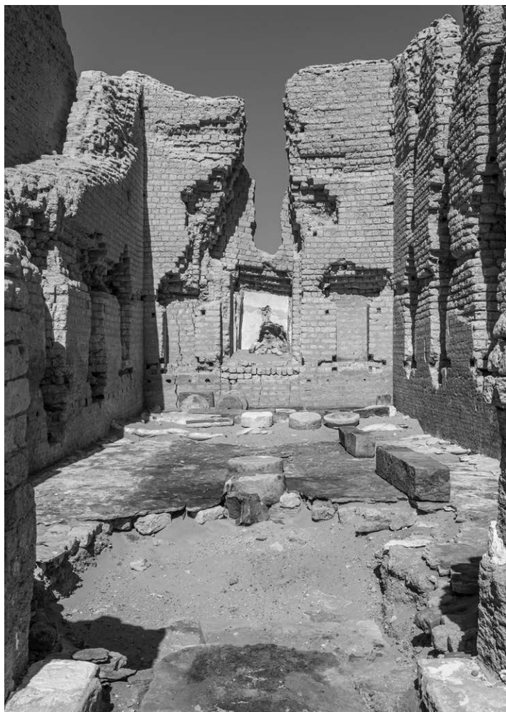
Fig. 3. La sala ST 6A

dal pavimento, anch'esso in parte conservato e costituito da sottili lastre di pietra locale. Si tratta di un edificio connesso con il culto, forse un deipneterion 19 ,