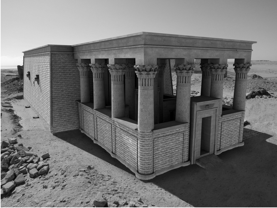
Fig. 13. Ricostruzione virtuale del contra-temple (realizzazione M. Limoncelli)

arco ( segmental pediment ) con un disco al centro a rilievo e con dentelli alla base. Si tratta dunque di una cappella isiaca, simile a quella rinvenuta a Medinet Madi, dedicata a Isis-Thermouthis, e alle raffigurazioni sulla monetazione di epoca romana 51 .