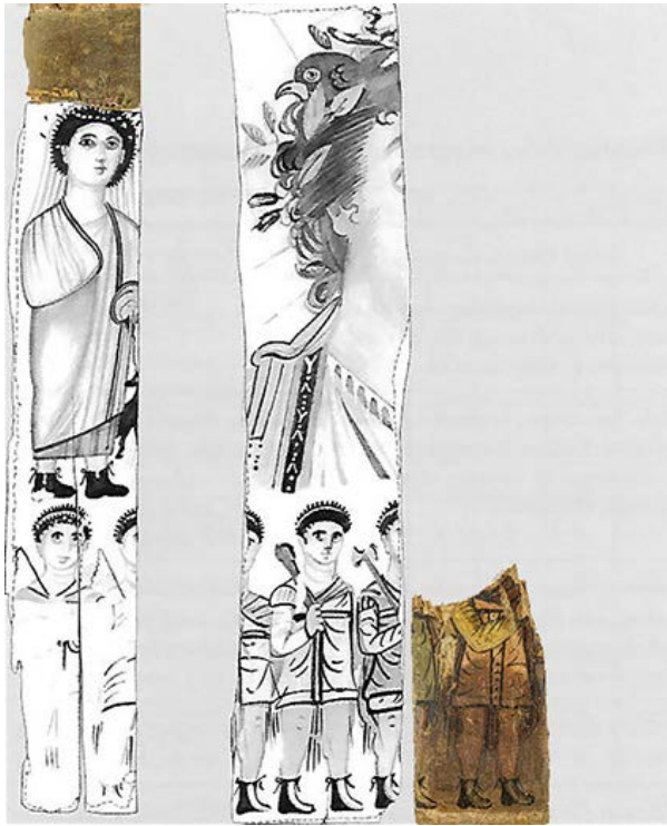
Fig. 6. Ricostruzione virtuale del pannello JE 31571b (@Vincent Rondot, Derniers visages des dieux d’Egypte , p. 107) con aggiunta di Dime 6291 a,b

7). Alquanto incomplete, esse ritraggono una divinità maschile talora in trono con un coccodrillo in grembo, circondata da una serie di personaggi armati, soldati o divinità in armi, oppure la parte destra di un busto di una divinità maschile radiata, con nimbo. In quest’ultima raffigurazione dalla chioma riccioluta del dio spunta la testa di un falco. Anche in questo caso il dio è circondato dalla stessa serie di personaggi armati, ed è affiancato da una figura femminile che tiene un cagnolino al laccio.