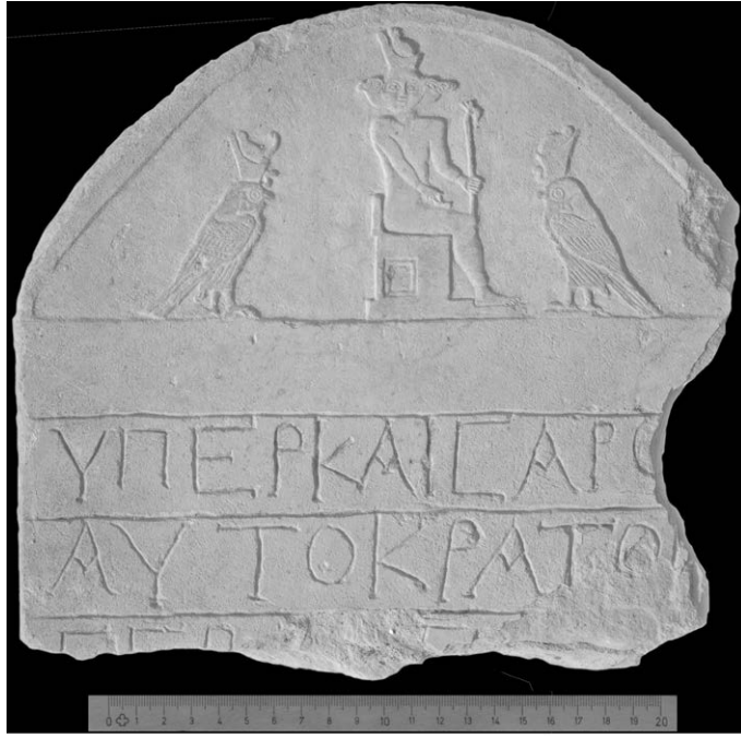
Fig. 10. Stele Dime ST10/713/3533

La mancanza del testo non consente una interpretazione precisa della raffigurazione, ma il significato del linguaggio iconografico è chiaro e rimanda ad una divinità solare e alla regalità divina: forse un esplicito riferimento alla propaganda imperiale romana 37 ? Anche in questo caso il contesto di rinvenimento della stele, il tempio del dio Soknopaios, ovvero di “Sobek signore dell’isola”, suggerisce l’identificazione del dio a tre teste con la divinità principale del tempio, altrimenti raffigurato come cocodrillo con testa di falco e corona pschent 38 .