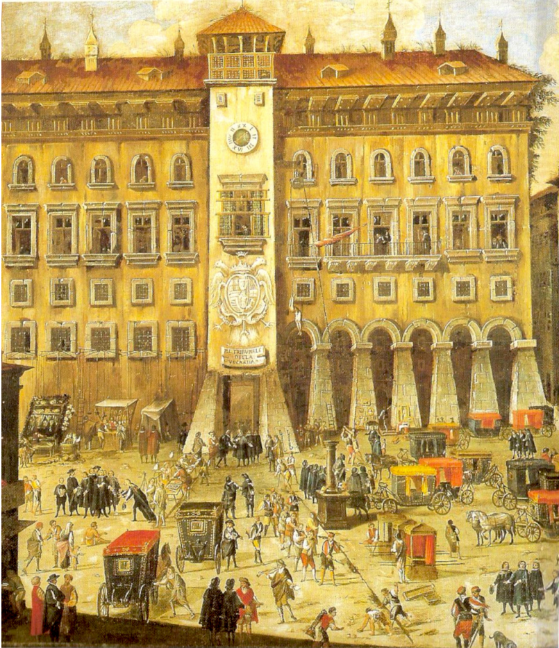
Carlo Coppola (?), La gran corte della Vicaria e la colonna infame (Museo Nazionale di San Martino, Napoli – Wikimedia Commons, https://commons.wikimedia.org/wiki/File:Tribunaledellavicaria.jpg ).