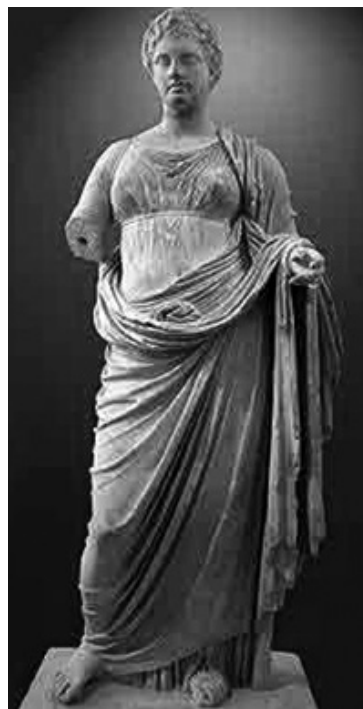
(fig. 2) Themis di Rhamnous (Chairostratos) inizi III sec. a.C.